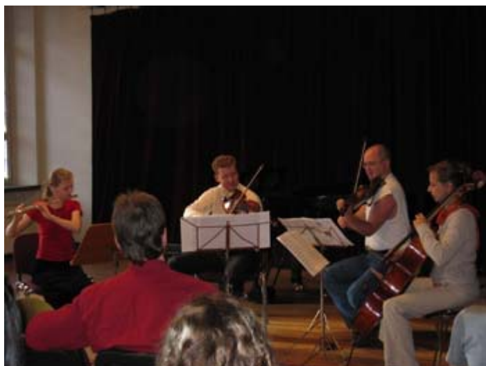
Kammarmusiklektion med Ginestra-kvartetten

Inom kammarmusik gavs det under ht 2004 tillfälle till gemensamt musicerande med den professionella Ginestra – kvartetten.