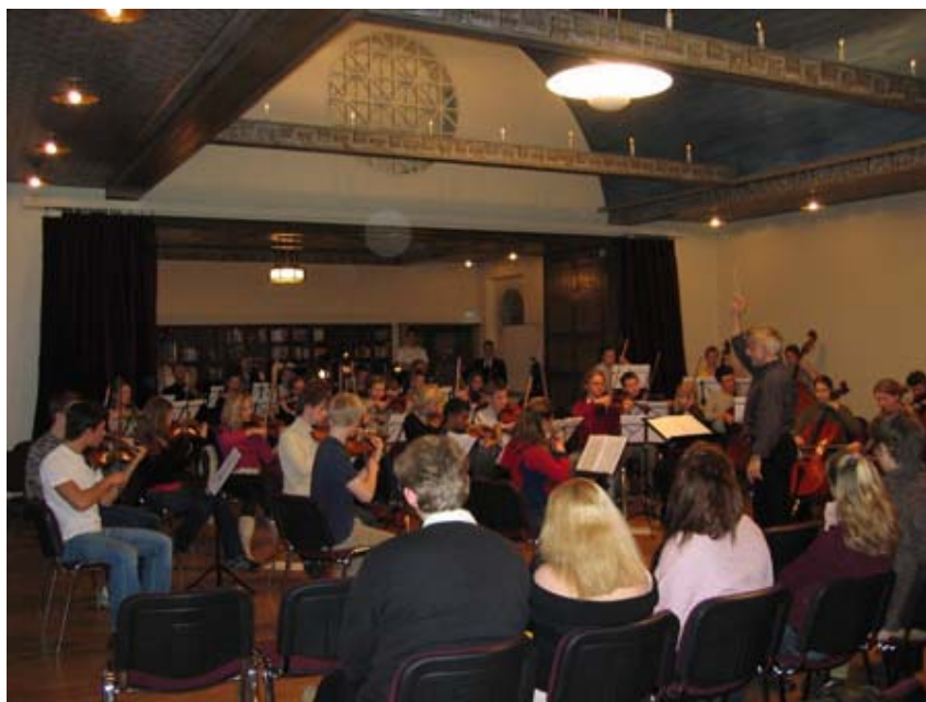
Konsert med Sankt Annes Symfoniorkester från Köpenhamn

I slutet av vt 2004 genomförde vi en koncentrerad musikperiod. Denna avslutades med en stor konsert med uppförande av delar av Mozarts opera Bastien & Bastienne