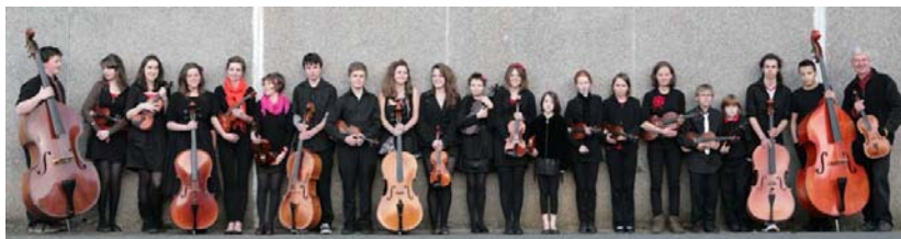
Penzance Youth Orchestra