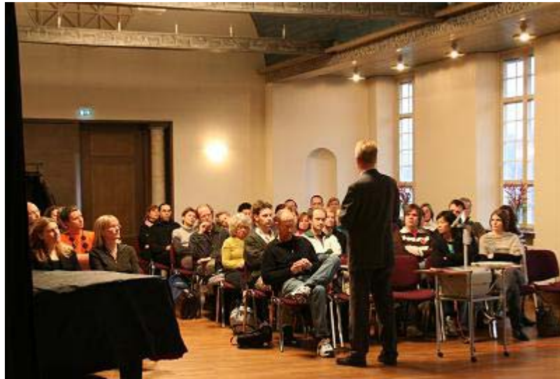
En inledande studiedag i projektet "Likvärdig bedömning och betygsättning"

Med början under ht 2005 inledde Stockholms Stads Utbildningsförvaltning ett samarbetsprojekt för Stockholms gymnasieskolor: "Likvärdig bedömning och betygsättning". Inom ramen för projektet har lärare från Nordiska