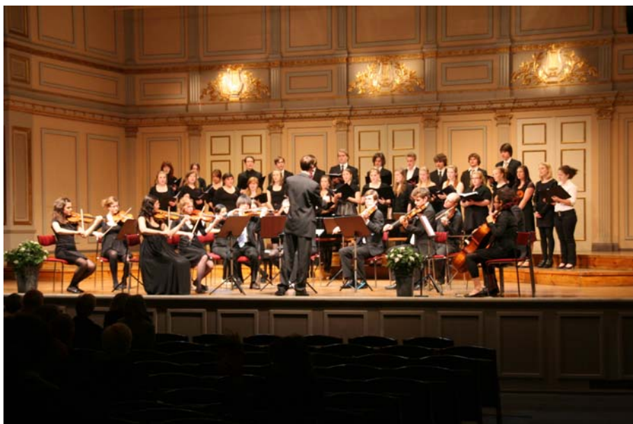
Konsert på Nybrokajen 11

Den 11 maj uppträdde eleverna på Nybrokajen 11 – där fick vi höra kammarmusik, större ensembler samt kör. Konserter på Nybrokajen 11 kommer vi att fortsätta med och nästa läsår kommer vårens avslutningskonsert att äga rum på Nybrokajen 11.