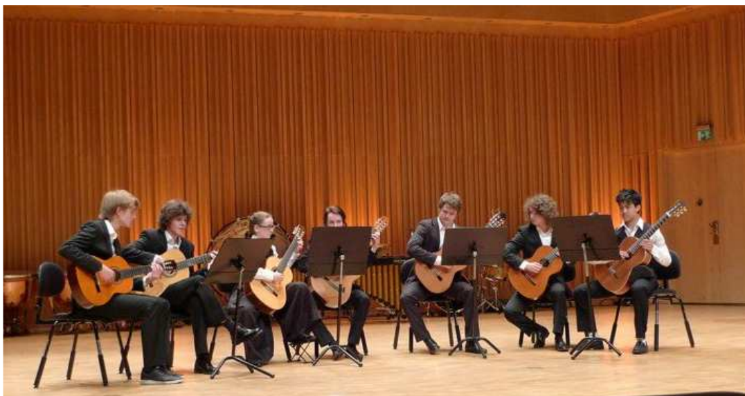
Gitarrensemblen på Västerås Konserthus

mycket uppskattat. Ett antal elever deltog också i RUMs solistävlingar och även detta år fick våra elever placera sig på pristagarpallen.