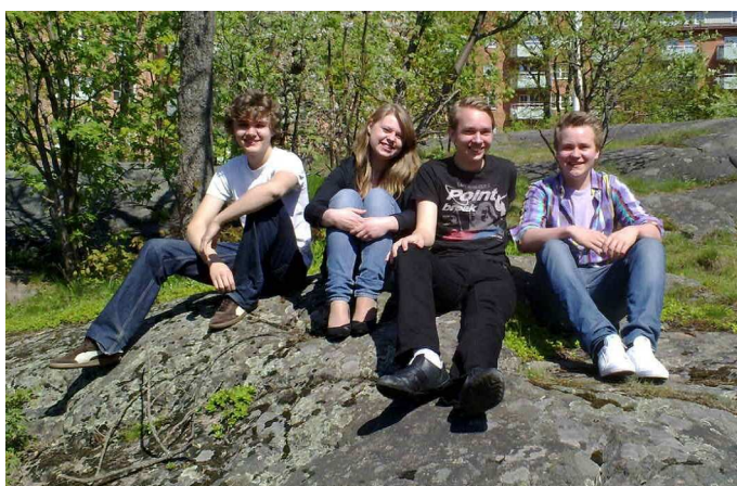
Vinnare i Stockholms Internationella Musiktävling

Under vt 2010 deltog fyra av våra elever i en stor internationell musiktävling i Stockholm. I mycket hård konkurrens erhöll alla fyra elever första pris i sina instrumentklasser!