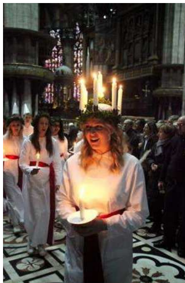
Lucia 2010 i domkyrkan i Milano

På inbjudan av Svenska Handelskammaren fick ett tiotal elever tredje året i rad möjlighet att åka till Italien och uppträda med ett Luciaprogram. Denna gång utökades resan till både Milano och Rom med uppträdanden i bl. a. Domkyrkan i Milano, Svenska Ambassaden i Rom och på Piazza di Pietra. Besöket var återigen mycket uppskattat av både eleverna och arrangörerna och redan nu planeras nästa års besök med ytterligare utökning till att omfatta även Schweiz.